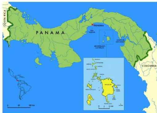
Figura N°1. Ubicación general de la República de Panamá y el Archipiélago de Las Perlas.

Panamá ocupa el extremo meridional del istmo centro americano, ha sido el puente a través del cual se han comunicado a lo largo de la historia los hombres y las especies animales de América Central y América del Sur. Su geografía es poco común, ya que se trata de un istmo alargado en forma de "S" estirada, que a diferencia de sus países vecinos, orientados de Norte a Sur, se