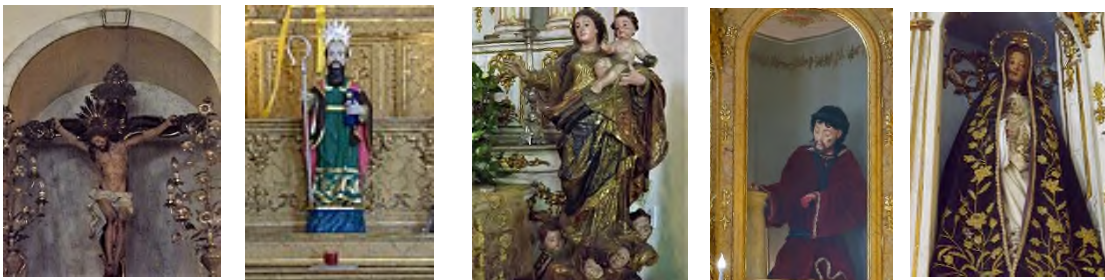
Imágenes de las Hermandades que tienen o han tenido su sede en la Iglesia de São Pedro Gonçalves

El hospital no se llegó a hacer muy probablemente por la falta de los recursos necesarios, los hermanos de la cofradía eran asalariados y pequeños comerciantes, aunque la hermandad contaba en el puerto con un "Almacén Aduanera (Trapiche Alfandegado)" que proporcionaría ciertos beneficios, no parecían ser suficientes pues a lo largo de su historia se ha visto en la necesidad de compartir su iglesia con otras hermandades con el fin facilitar el mantenimiento de la iglesia y el sostenimiento del culto.