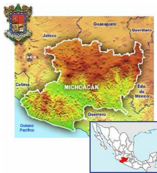
Ubicación del estado de Michoacán en México

El estado de Michoacán se encuentra localizado en el extremo sur occidental de la meseta central de Méjico, rodeado por los estados de Guerrero, México, Querétaro, Guanajuato, Jalisco, Colima y el Océano Pacífico. Su capital es Morelia, fundada en el 1541 por orden del Virrey Antonio de Mendoza, siendo Felipe II quien la hace capital del estado con el nombre de Valladolid, es una ciudad colonial nombrada “Patrimonio de la Humanidad”.