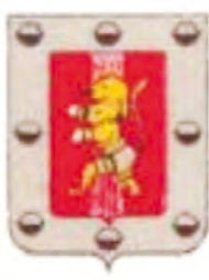
Ayuntamiento de Frómista