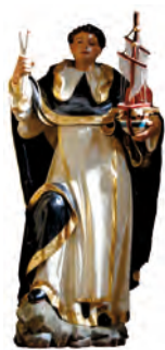
Cofradía San Telmo